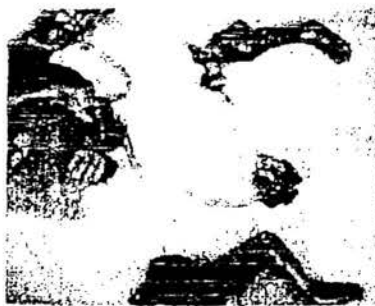
Abtreibung durch Kürettage in der 12. Schwangerschaftswoche

Abtreibung durch Kürettage (Auskatzung) in der 12. Woche: Mit einem scharfen, gebogenen Messer wird der Körper des Kindes in kleine Stücke geschnitten und die Plazenta von den Innenwänden der Gebärmutter geschält. Auch hier kann man mühelos die einzelnen Körperteile erkennen. ➤