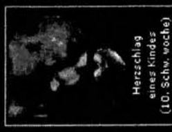
Herschlag eines Kindes (10. Schw. Woche)