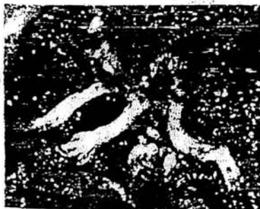
Abtreibung durch Absaugen in der 10. Schwangerschaftswoche

Der schwangeren Frau wird ein Saugrohr in die Gebärmutter eingeführt. Durch den Sog wird das Kind buchstäblich in Stücke gerissen. Auf dem Bild sehen Sie ganz deutlich Ärmchen, Beinchen ... ➤