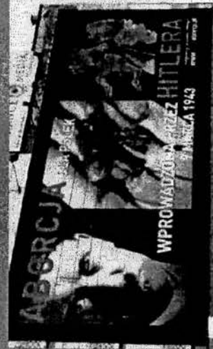
Deutsche Sprache in Polen gegen den vorgeblichen Kindermord im Mordelb

Heutzutage müssten die gesetzlichen Regelungen zur Abtreibung im Frage gestellt werden, fährt der Papst fort. "Parlamente, die solche Gesetze schaffen und verkünden, müssen sich darüber im Klaren sein, dass sie ihre Machtbefugnisse überschreiten und in einem offenen Konflikt mit dem Gesetz Gottes und dem Gesetz der Natur verharren."